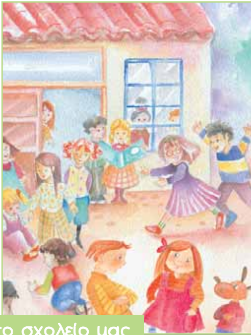
το σχολείο μας