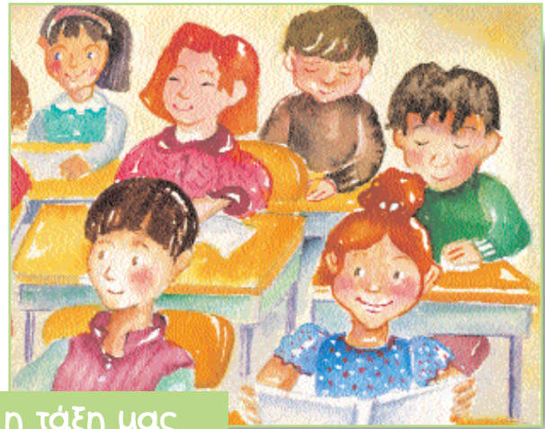
η τάξη μας