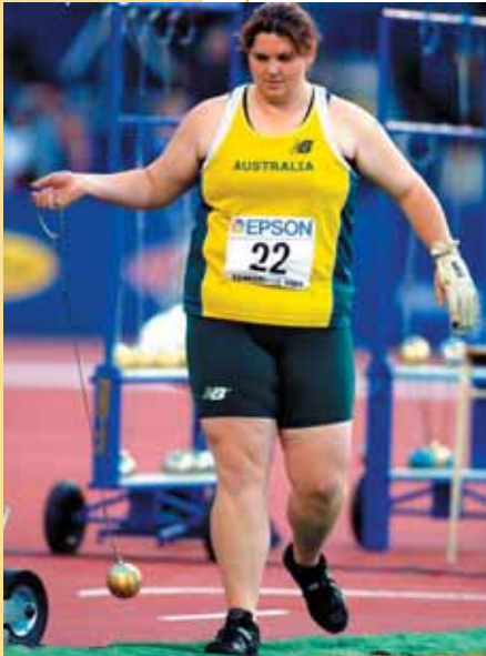
Η Bronwyn Eagles που πήρε την τρίτη θέση στο Παγκόσμιο του 2001