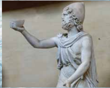
Ο Οδυσσεύς προσφέρει κρασί στον Πολύφημο, μουσείο Chiaramonti

Τον άντρα τον πολύτροπο πες μου, θεά, που χρόνια παράδερνε σαν πάτησε της Τροίας τ' άγιο κάστρο κι ανθρώπων γνώρισε πολλών τους τόπους και τη γνώμη κι έπαθε πλήθος συμφορές στα πέλαγα ζητώντας πώς στην πατρίδα του άβλαβος να πάει με τους συντρόφους.