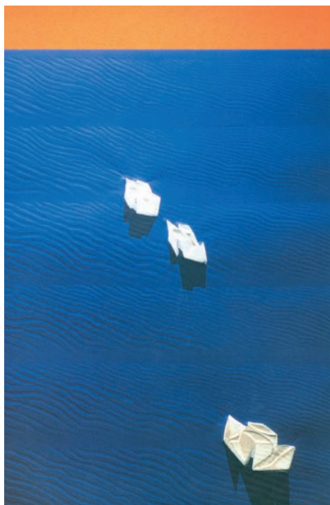
Τόνια Νικολαΐδη, Άσπρα χάρτινα καράβια, όνειρα χαρούμενα που ταξιδεύουν

απαράλλαχτα όπως ένα κόκκινο λουλούδι μέσ' σε πράσινα φύλλα.