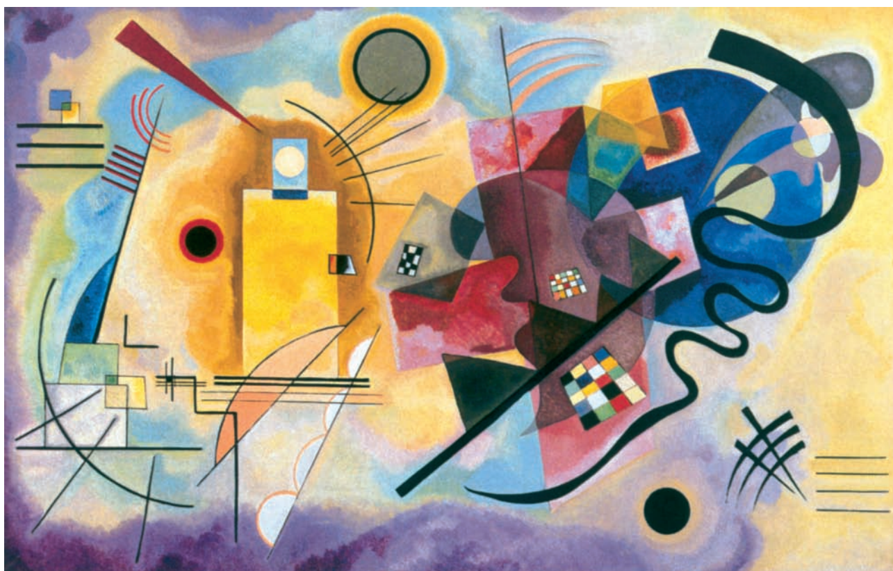
Βασίλι Καντίνσκι, Κίτρινο, μπλε