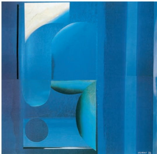
Οδυσσέας Ελύτης, Σύνθεση στο μπλε