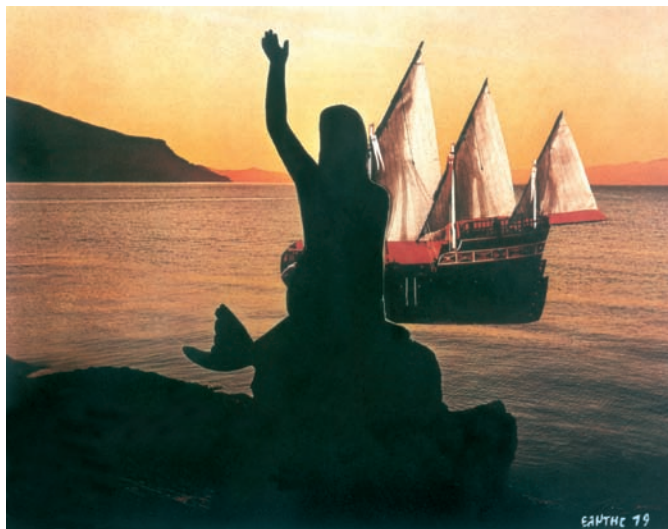
Οδυσσεάς Ελύτης, Η γοργόνα

Εικόνες από το Αιγαίο συνθέτουν το θαλασσινό τοπίο του ποιήματος. Οι άνθρωποι ζουν ευτυχισμένοι μέσα στη φύση, στο όνειρο και στην ελπίδα