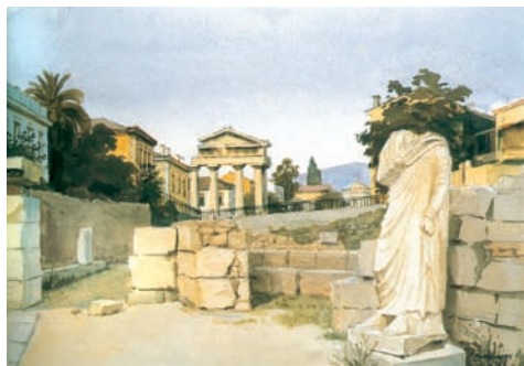
Γιώργος Μανουσάκης, Αρχαία Αγορά

Μέσ' στη μονότονη βροχή τις λάσπες την τερφήν ατμόσφαιρα τα τραμ περνούνε και μέσ' από την έρημη αγορά – που νέκρωσε η βροχή – πηγαίνουν προς τα τέρματα