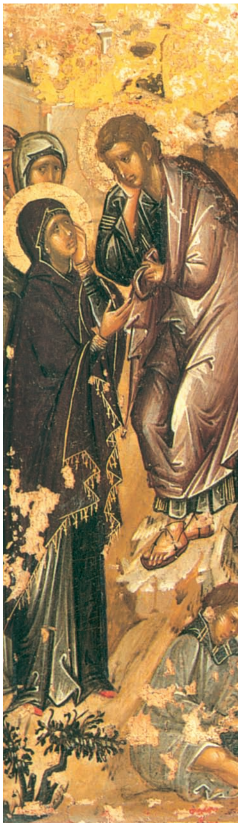
Σταύρωση, αρχές 15ου αι. Πάτιμος

Η τέχνη της εικόνας ή του λόγου ασχολήθηκε από πολύ νωρίς με τον θρήνο της Παναγίας για τον Χριστό, τόσο ως θέμα στην ορθόδοξη εικονογραφία και υμνογραφία, όσο και με τα μοιρολόγια στο δημοτικό τραγούδι. Ο θρήνος αυτός συνδυάστηκε αμέσως με τον πόνο της μάνας για τον χαμό του γιου της, πήρε τη χροιά της δραματικής αντίθεσης του θανάτου ενός νέου μέσα στην ανοιξιάτικη φύση, και εκφράστηκε, αντίστοιχα, και από τη νεοελληνική ποίηση στα νεότερα χρόνια, συνενώνοντας παλιούς και νέους εκφραστικούς τρόπους. Στο ποίημα του Κώστα Βάρναλη που ακολουθεί, οι χαμένες προσδοκίες της Παναγίας-Μάνας, παρά την έκφραση του ανθρώπινου πόνου, προβάλλονται πάνω στην τελική αποδοχή της θυσίας.