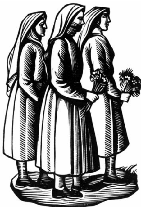
Α. Τάσος, το Θυσιαστήριο της Λευτεριάς, 1945