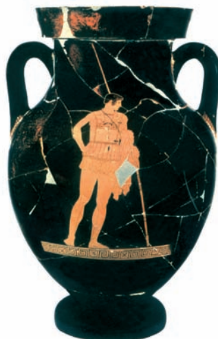
Αμφορέας με τον πρωταγωνιστή της Ιλιάδας, Αχιλλέα