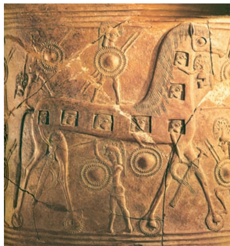
Μια από τις πιο παλιές παραστάσεις του Δούρειου Ίππου. Εδώ φαίνονται εφτά μέσα στο άλογο. Μερικοί ετοιμάζονται να κατεβούν βγάζοντας πρώτα τα χέρια τους με τα όπλα από τα ανοίγματα. (Γύρω στο 670 π.Χ. Μύκονος, Αρχαιολογικό Μουσείο)