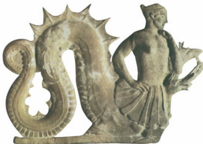
Η Σικύλλα. Εδώ παριστάνεται μισή γυναίκα και μισή θαλάσσιος δράκοντας, ενώ από τη μέση της φυτρώνουν κεφάλια σκύλων με το λαϊμό και τα μπροστινά τους πόδια. (Ανάγλυφο από τη Μήλο, 475-450 π.Χ., Λονδίνο, Βρετανικό Μουσείο)