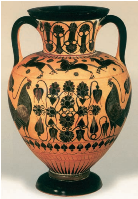
Πολεμική σκηνή συνδυασμένη με εικόνες της φύσης σε αμφορέα του 540-530 π.Χ. (Würzburg, Martin von Wagner Museum der Universität Würzburg)