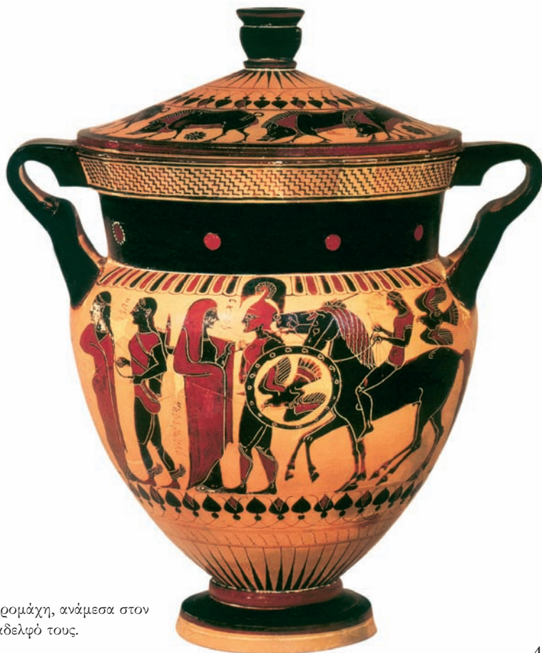
Κρατήρας με τον Έκτορα και την Αδρoμάχη, ανάμεσα στον Πάρη, την Ελένη και ένα μικρότερο αδελφό τους.

άπνοιο σπαθί: ο Οδυσσέας χτυπά αλύπητα τους Τρώες