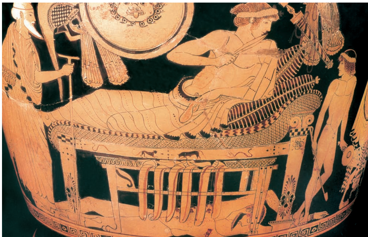
Ο Πριάμος φέρνει δώρα στον Αχιλλέα, ζητώντας του το νεκρό κορμί του Έκτορα