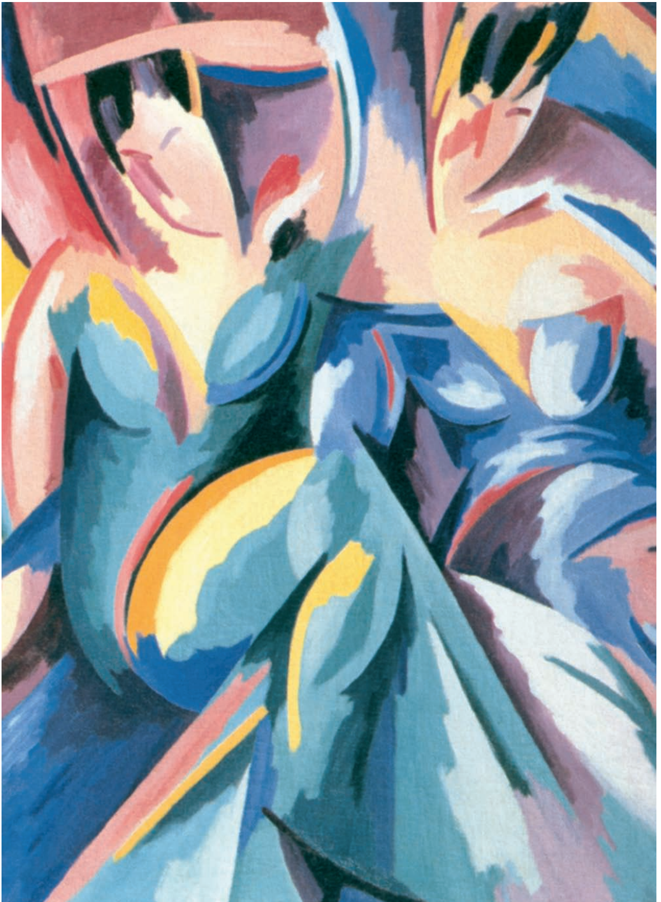
Αλμπέρτο Μανιέλι, Λυρική έιρηξη