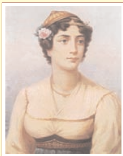
▲ Μαντώ Μαυρογένους