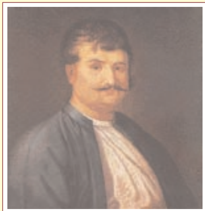
▲ Ρήγας Φεραίος

Ο Αριστοτέλης μίλησε για το Ρήγα Φεραίο: Ο Ρήγας με το "Θούριο" και τ' άλλα γραφτά του συγκίνησε και ξεσήκωσε τους σκλαβωμένους Έλληνες. Από τη χορωδία του σχολείου ακούγεται ο Θούριος και η Ρωμιούσνη.