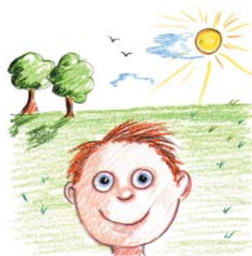
κάνει καλό καιρό