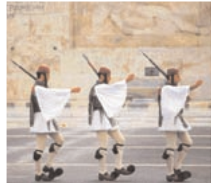
▲ Άγνωστος Στρατιώτης

Στο χωριό έμειναν δυο μέρες. Μετά πήραν το λεωφορείο κι