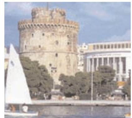
▲ Λευκός Πύργος