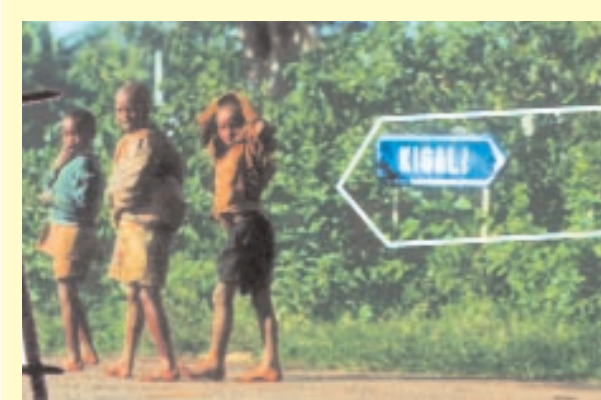
Παιδιά πρόσφυγες στο δρόμο από Κίγαλι προς Rukara. Περιοδικό GEO Lino (γερμανική έκδοση, Νο 6, 2004).

«Ο Χ..., 16 χρονών, είναι ένα από τα 2.500 παιδιά που πέρασε από ένα πρό-