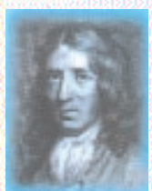
Γουίλιαμ Ντάμπιερ (1652 - 1715)

Το μαύρο είναι για τους ιθαγενείς. Το κίτρινο είναι για τον ήλιο. το κόκκινο είναι για τη γη.