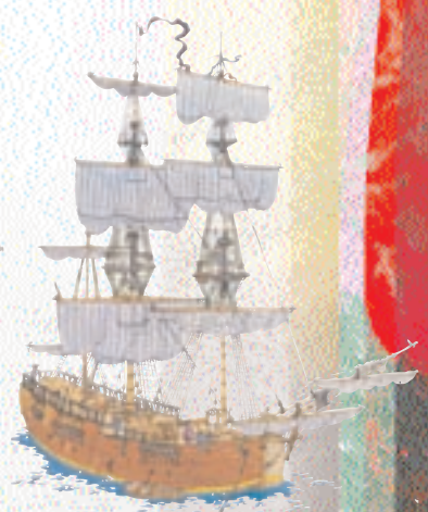
Άμπελ Τάσμαν (1603 - 1659 περ.)