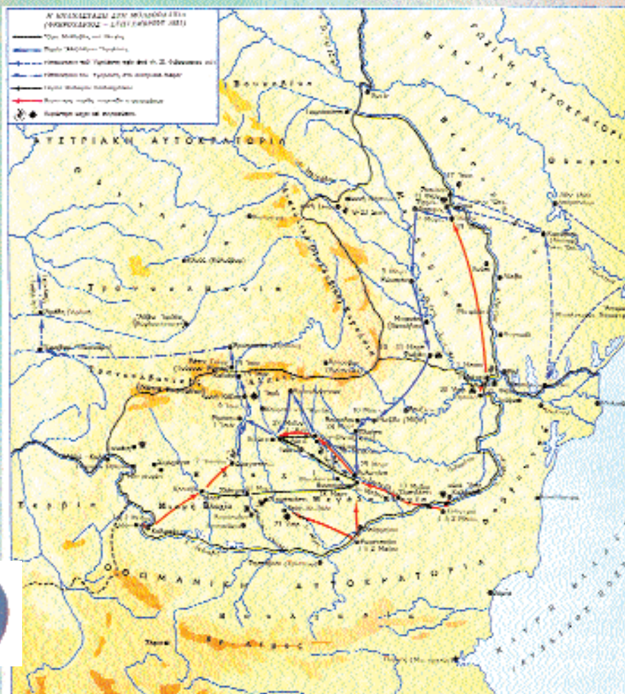
Χάρτης Επανάστασης της Μολδοβλαχίας.