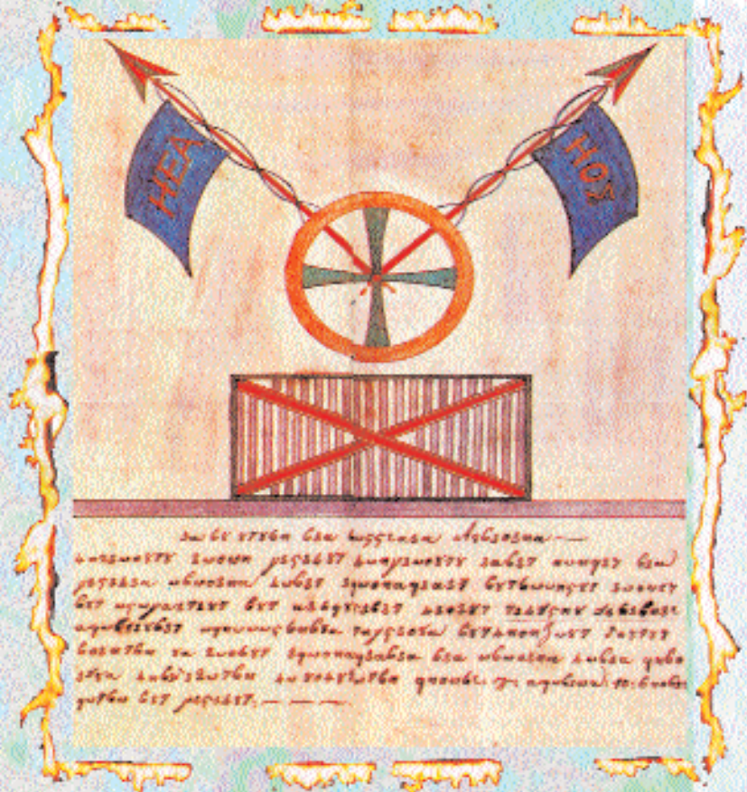
Κείμενο της Φιλικής Εταιρείας γραμμένο στη μυστική γλώσσα των Φιλικών