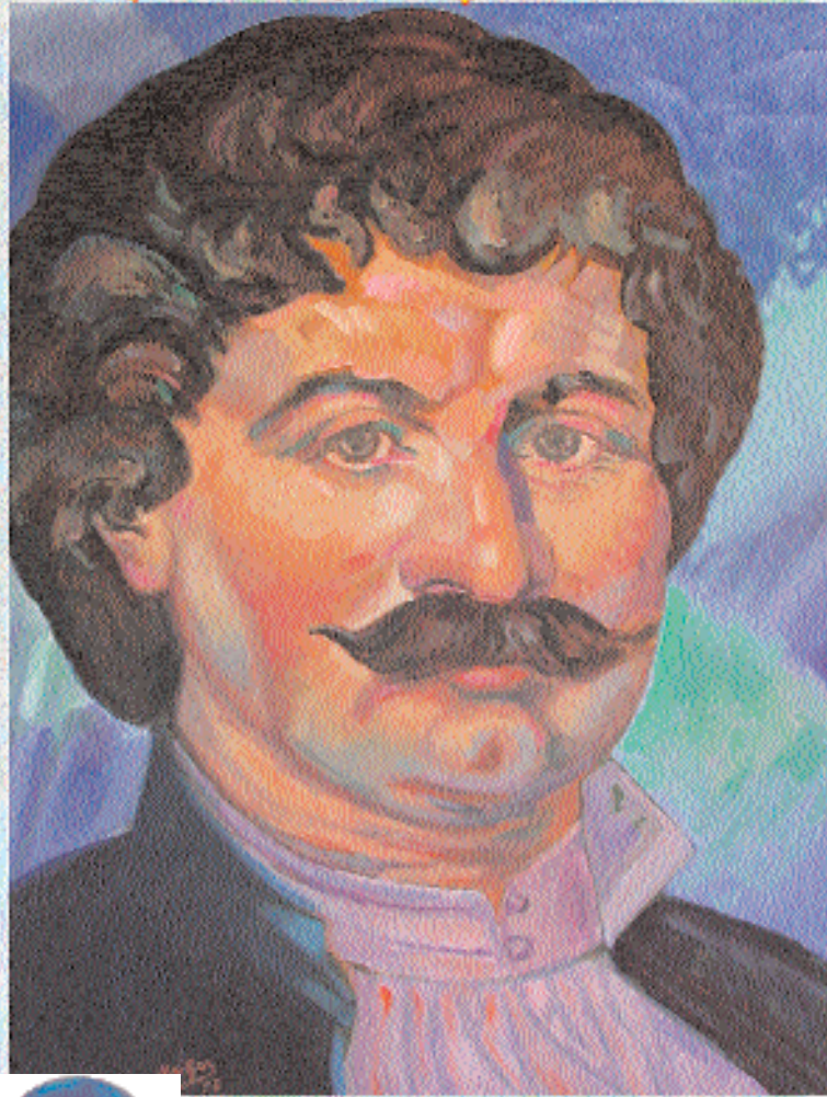
Ο Ρήγας Φεραίος