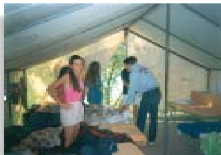
Βάρκιζα-κατασκίνωση (καλοκαίρι 2001)