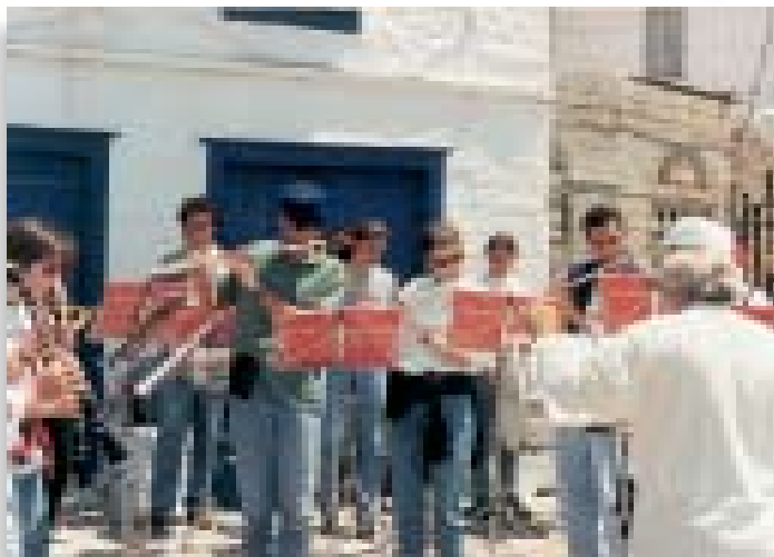
Συναυλία στο δρόμο