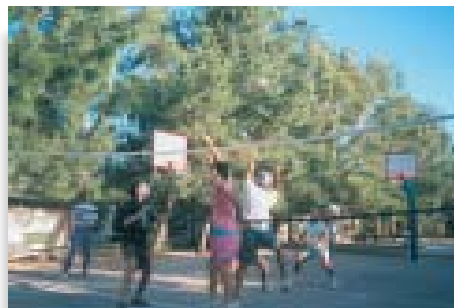
Προπόνηση για το Πρωτάθλημα Πετοσφαίρισης Νέων