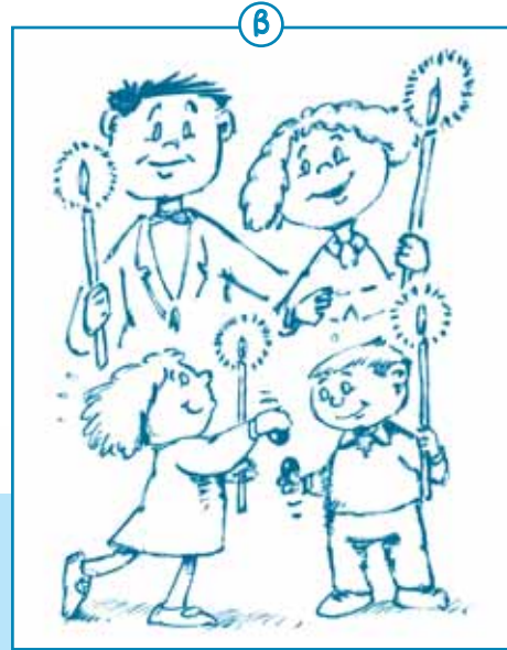
Στην εικόνα β βλέπω