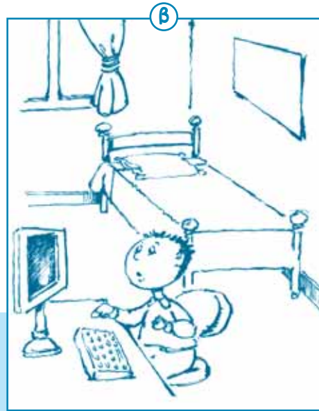
Στην εικόνα β βλέπω