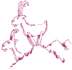
Τα ζώα του βουνού