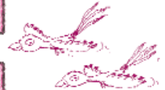
Τα πουλιά του ουρανού