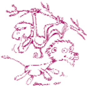
Τα ζώα της ζούγκλας