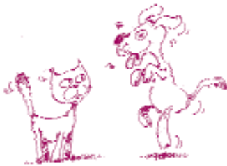
Τα ζώα του σπιτιού