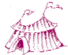
Τα ζώα του τσίρκου