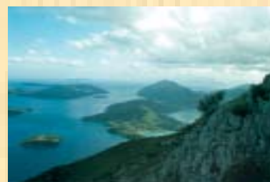
Το νησί Σκορπίος