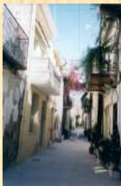
Στενοί δρόμοι στο Ρέθυμνο

οι διακοπές η πισίνα το μπάνιο, το κολύμπι το σωσίβιο το ενυδρείο ο δύτες, η δύτερια η κατάδυση η ιστιοπλοΐα η ιστιοσανίδα, το σέρφιγκ η ψαροταβέρνα το γαϊδουράκι, ο γάιδαρος