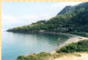
Παραλία στην Πελοπόννησο