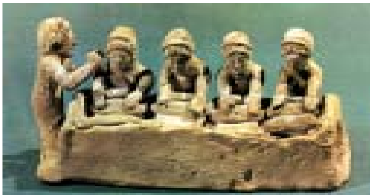
Τέσσερις γυναίκες όρθιες πλάθουν τη ζύμη, μία γυναίκα αριστερά παίζει διάυλο, ρυθμίζοντας τις κινήσεις των γυναικών που ζυμώνουν. (5ος αι. π.Χ.)

Εύα: Έχεις δίκιο, μαμά! Αυτό δεν το σκέφτηκα. Από αύριο αναλαμβάνω να καθαρίζω το δωμάτιό μου και να σε βοηθώ στο σπίτι κάθε Σαββατοκύριακο.